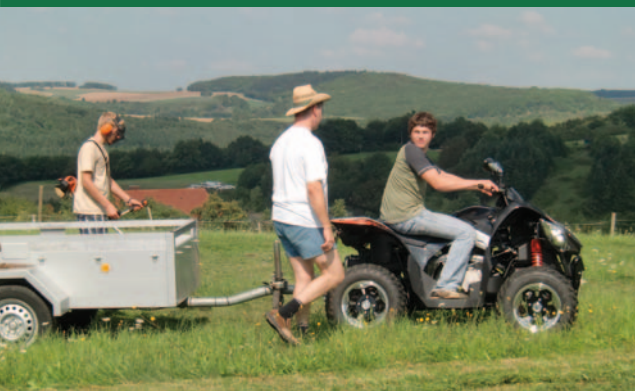
Impression von Dorf–Leben 1 in Katzenbach

6 Uhr, Warnschilder weisen auf die werktäglichen Sprengzeiten hin. Die Bahn taktet im Rheinland–Pfalz–Takt und die Pendlerströme auf der B 270 tun ihr Übriges zur Strukturierung der Zeit im Dorf.