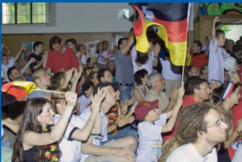
Kleine Kirche während der WM 2006: Volles Haus und Riesenstimmung beim Public Viewing

(Red.) Im Juni ist es wieder so weit: es ist EM! In Polen und der Ukraine rollt der Ball und in der „Kleinen Kirche“ in Kaiserslautern wird jeder Spieltag des deutschen Teams ein Event. Die Evangelische Jugend lädt alle zum Public Viewing ein, zum Mitfiebern mit dem deutschen Nationalteam, ebenso